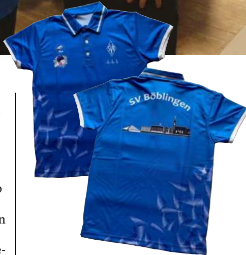
Trikot von vorne und Trikot-Rücken

Wie alle Abteilungen benötigen auch wir Zuwachs. Interessierte dürfen gerne zu einem Probetraining vorbeischaun.