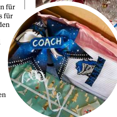
Der Weihnachtsmann war da. Der Gabentisch der Cheerleader mit Weihnachtsgeschenken und Gebäck