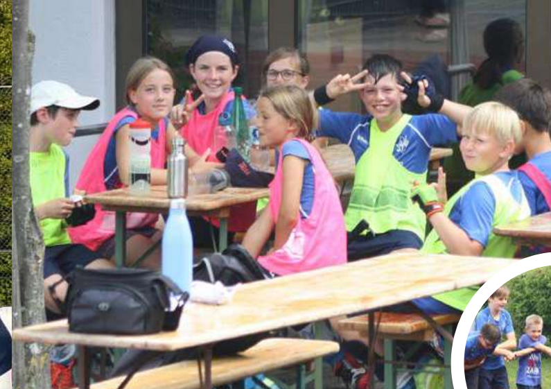
Auch außerhalb des Hockeyfeldes hatten alle viel Spaß bei Freizeitspielen und gemeinsamem Mittagessen.