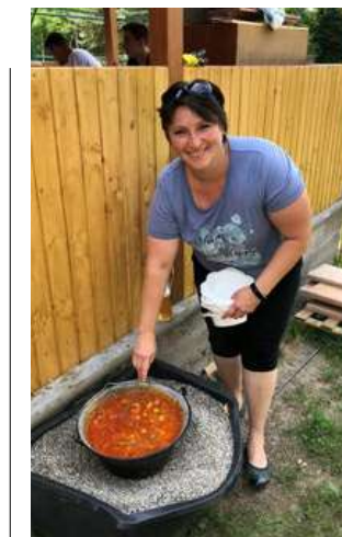
Kulinarische Köstlichkeiten auf dem Internationalen Sommerfest

Ein Sommerfeste ist insbesondere nach langer Corona-Pandemie wichtig für die Mitgliederpflege eines Vereins, denn neben dem ehrenamtlichen Engagement sollen auch der Spaß und das Zwischenmenschliche nicht zu kurz kommen. So wurde kurzerhand ein Internationales Grillfest organisiert bei dem jeder eine kulinarische Köstlichkeiten aus seiner Heimat mitbrachte. Beim Tischtennispielen und beim Essen konnte man ungezwungen und leicht mit den Sportlern, deren Freunden und Eltern ins Gespräch kommen und die Integration verschiedener Kulturen wird zum Selbstläufer. ▶