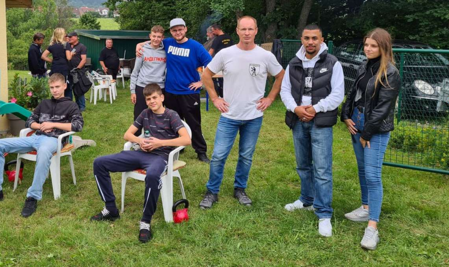
Internationales Sommerfest der Böblinger Box-Abteilung

trainierten und spielten in der Dreifelder-Halle. Neben der Verbesserung der sportlichen Fähigkeiten wurde so die Persönlichkeit und Zusammenarbeit im Team weiterentwickelt. Es war ein ausgezeichnetes Blocktraining, bei dem die Athleten und Trainer wieder viel gelernt haben.