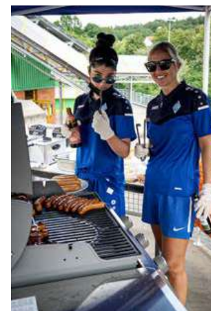
Eine echte Stadionwurst darf nach einem Spieltag nicht fehlen!