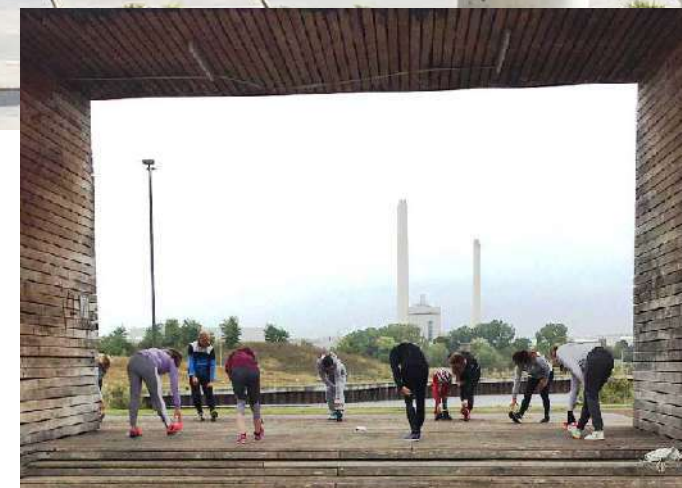
In sportlicher Runde: Outdoorfitness auf dem Flugfeld.

Sport tut gut – dem Körper und der Seele. Wenn man ihn mit Freunden teilen kann, umso mehr.