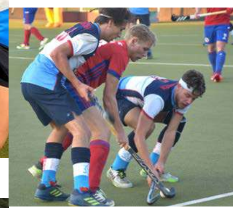
Das Ziel der neuen Saison? Klassenerhalt in der vierthöchsten Spielklasse!