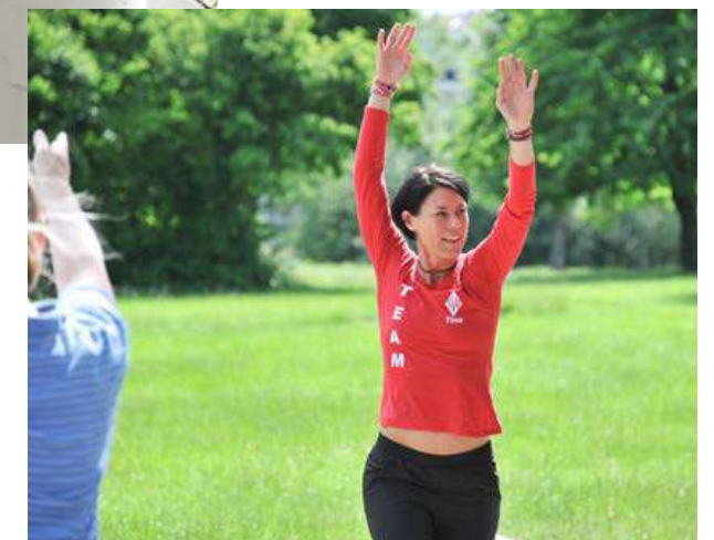
Auch mit kleinen Schritten lässt sich die Begeisterung für Sport beginnen. Fangt einfach an und lasst euch darauf ein.