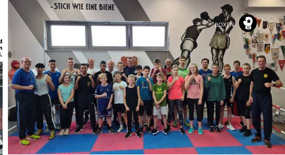
Die Teilnehmer und Trainer am gemeinsamen Blocktraining in Saalfeld.