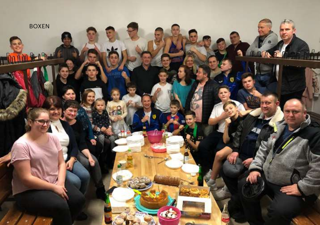
Die Böblinger Boxer, Eltern und Trainer beim gemeinsamen Weihnachtsfest