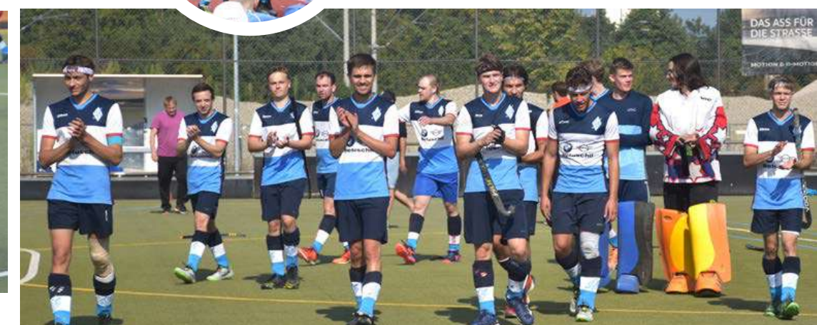
Zufrieden mit den erreichten sieben Punkten aus fünf Spielen sind die Hockeyherren in die Winterpause der 2. Regionalliga Süd gegangen.