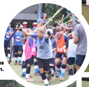
Der Hockey-Nachwuchs kam voll auf seine Kosten.

Mehr Informationen finden Sie auf: www.svb-hockey.de