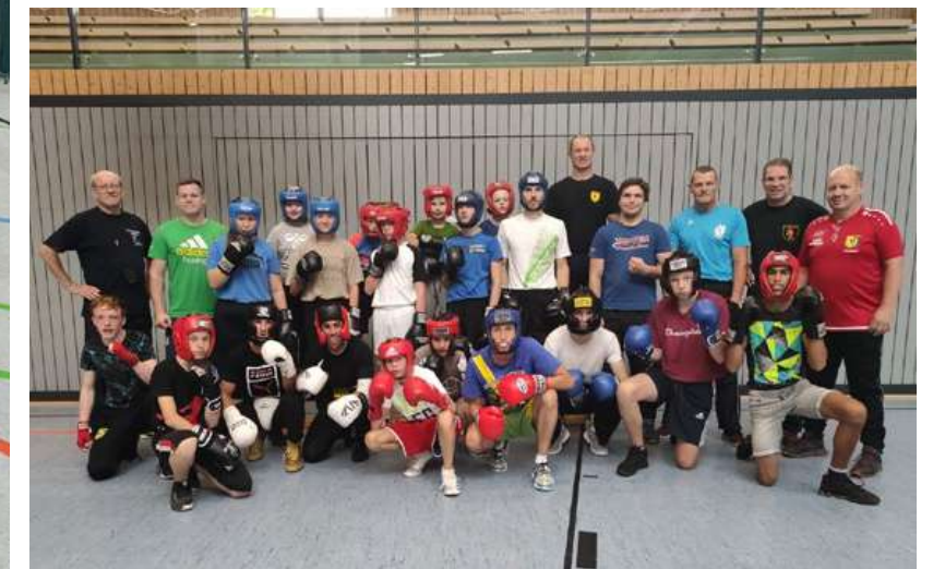
Die Teilnehmer und Trainer kurz vor dem Sparring in Saalfeld.

Die Böblinger reisten am Freitag an. Der Samstagmorgen begann mit einem erfrischenden Frühsport und einem gemeinsamen Frühstück in der Dreifelder-Halle in Gorndorf. In zwei Trainingseinheiten am Samstag und einer Einheit am Sonntag wurden Partnerübungen und Sparringskämpfe zur Verbesserung der technischen und taktischen Feinheit des Fechtens mit der Faust im Ring praktiziert. Unter der Anleitung der erfahrenen Trainer stiegen mit jeder Trainingseinheit die Erfahrungen und der Zusammenhalt in der Gruppe. Wichtig für die Kameradschaft der jungen Sportler war auch die gemeinsame Zeit auf engstem Raum. Die Boxer schliefen, ▶