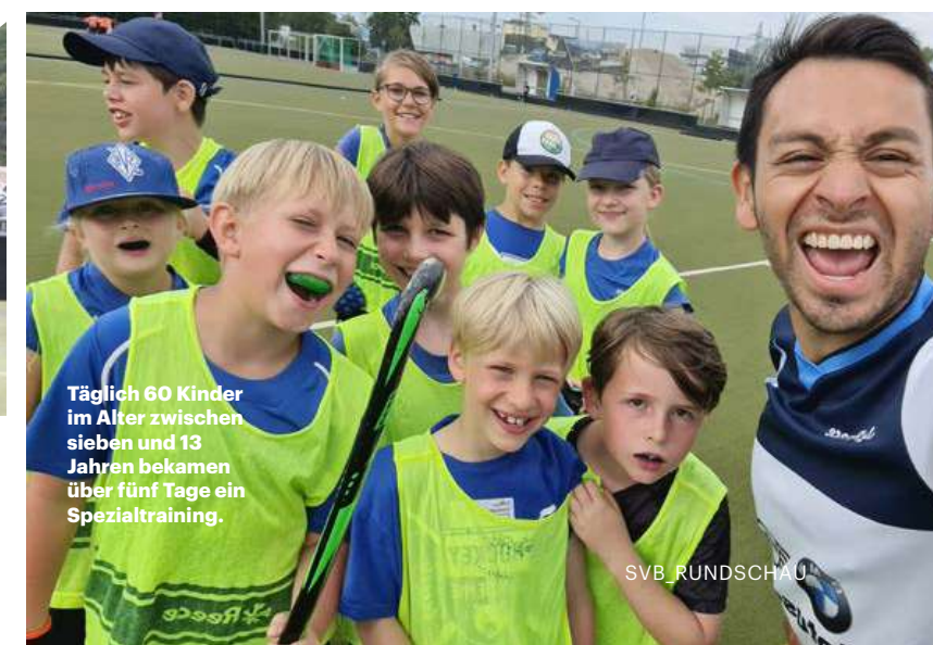
Täglich 60 Kinder im Alter zwischen sieben und 13 Jahren bekamen über fünf Tage ein Spezialtraining.