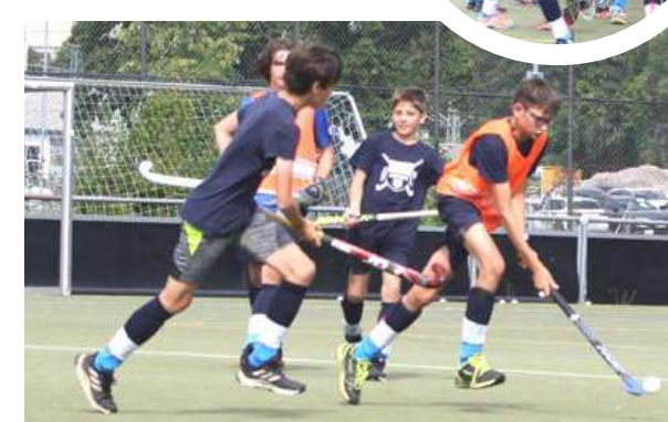
Hockeycamp in der letzten Sommerferienwoche – so startet man wieder voller Elan in die Schulzeit.