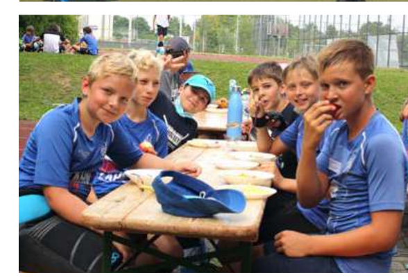
Gestärkt spielt es sich noch besser Hockey.