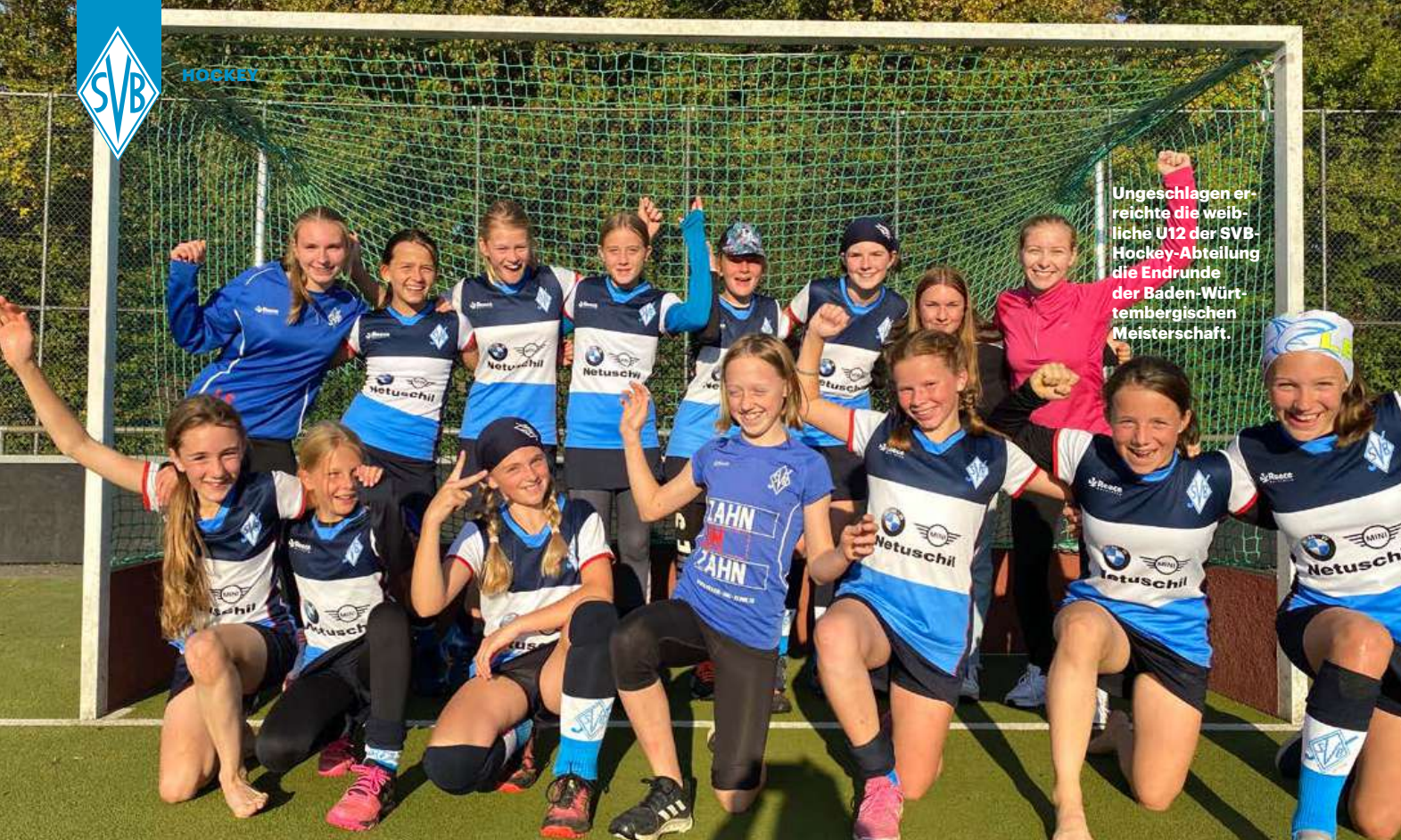
Ungeschlagen erreichte die weibliche U12 der SVB-Hockey-Abteilung die Endrunde der Baden-Württembergischen Meisterschaft.