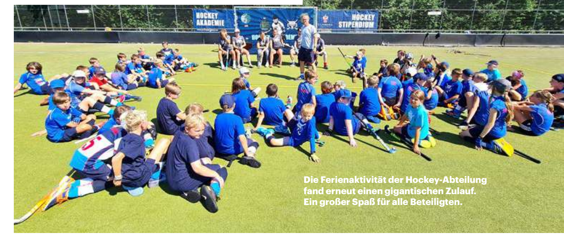
Die Ferienaktivität der Hockey-Abteilung fand erneut einen gigantischen Zulauf. Ein großer Spaß für alle Beteiligten.