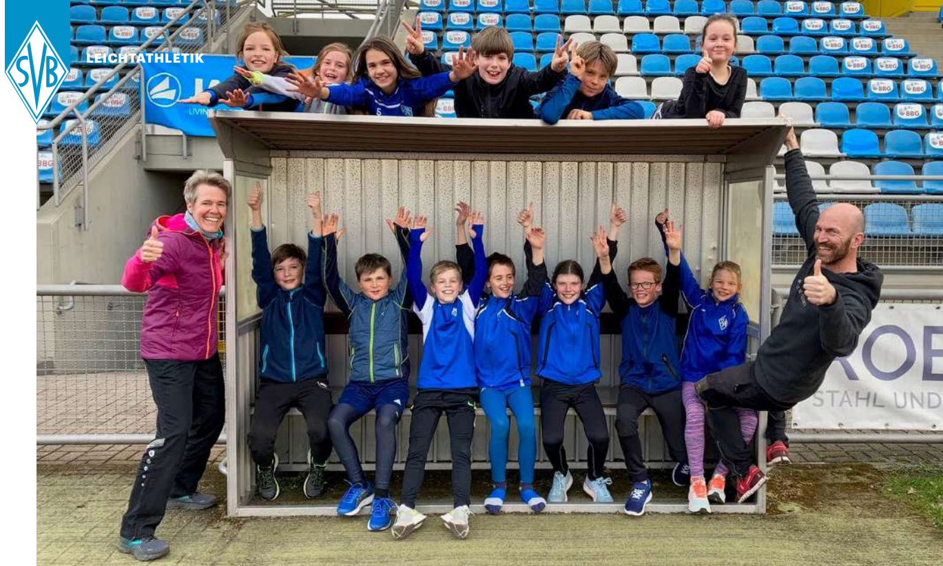
Im Trainingslager ging es mit viel Spaß sportlich zur Sache.