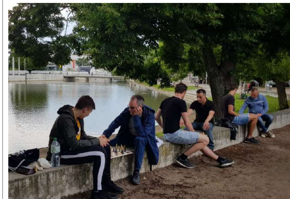
Flashmob See. Frische Luft für noch mehr Konzentration

die sich um den gesamten See ziehen. Von Kind bis Trainer war eine breite Spanne an Altersgruppen vertreten. Interessierte Passanten hatten die Möglichkeit, sich an den freien Brettern auszutoben oder uns herauszufordern. So konnten wir gemeinsam drei Stunden an einem Sonntagnachmittag gemeinsam verbringen und auch einige neue Gesichter zum Vereinschach begeistern. Im nächsten Sommer bei gutem Wetter und weniger Corona-Hemmnissen ist schon eine Wiederholung geplant.