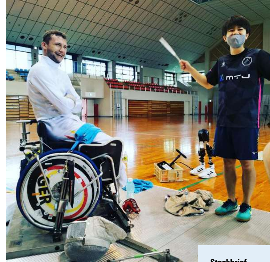
Optimale Trainingsbedingungen in Japan.

Mehr Informationen unter: www.fechten-boeblingen.de